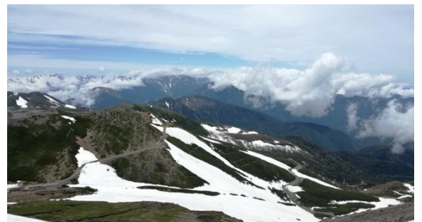
図 1. 高山帯の景観。乗鞍岳では、標高約 2,500m 以上の森林限界より高標高域に成立している。

この問題を解決するため、18 目 79 種の節足動物から DNA を抽出し、等量で混ぜ合わせて擬似的な餌生物群集を作成し、糞の DNA メタバーコーディングと同様の分子実験および解析を実施することで、節足動物の分類群間の PCR 増幅効率の違いを定量しました。得られた分類群ごとの増幅効率を用いて、鳥類の糞に対する DNA メタバーコーディングの結果を補正