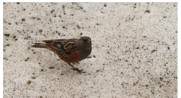
図 2. 高山帯の残雪上で餌を探すイワヒバリ