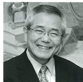
米パデュー大学 根岸 英一特別教授 (帝人グループ名誉フェロー) 帝人久村奨学生第5回生(1957年)

そして自らの「夢」を見つけたら真理を突き詰めるまで、とことんチャレンジしてください。今後の皆さんの大いなる活躍に期待しています。