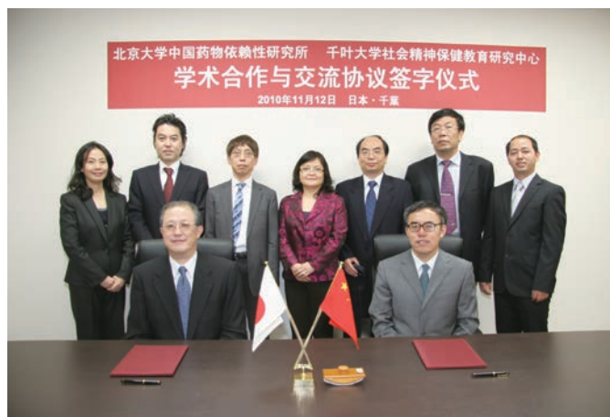
中国・北京大学との部局間交流協定(2010年11月) Interdepartmental exchange agreement with Peking University, China (November 2010)