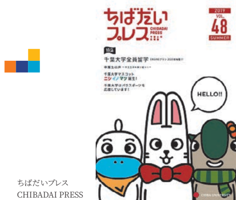
ちばだいプレス CHIBADAI PRESS

In order to improve the university brand, Chiba University’s efforts are communicated to many stakeholders through various publications and goods such as “CHIBADAI PRESS”.