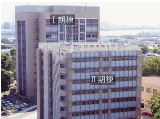
医薬系総合研究棟 I・II Medical and Pharmaceutical Sciences Building I and II

大学院組織改革に伴い、西千葉地区にあった薬学部は亥鼻地区に新しい研究棟を建築し、両学部は集結することとなった。建物新営の工事は2期にわかれ、I期棟・II期棟の2つの建物が建設された。医薬系総合研究棟I期棟は、2003年11月に竣工し、1～6階に薬学部(12研究室)が入居し、7～9階にはバイオメディカル研究センターおよび全学共同利用研究室スペースが確保された。II期棟は、東日本大震災による工事停止等、種々の紆余曲折を経たものの、2011年夏に完成し、地下1階～地上6階に事務室および薬学部が入居し、7階は全学共同利用研究室スペースとして利用されることとなった。