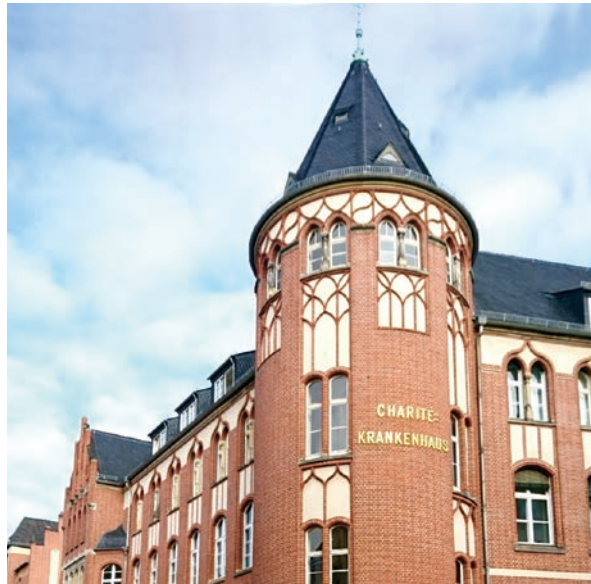
写真1-2-6-1 シャリテ・ベルリン医科大学