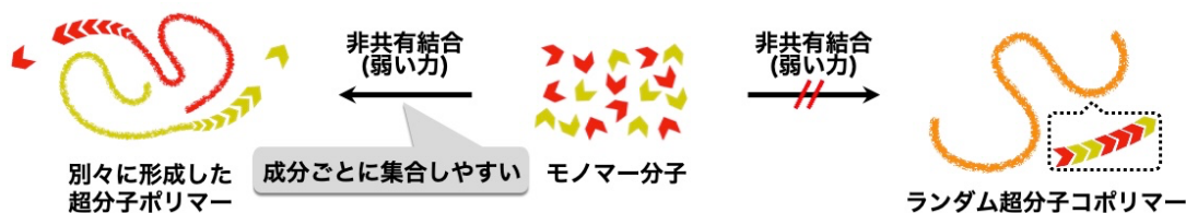
参考図1. ランダム超分子ポリマーの模式図

2種類以上の分子を多数結合させて作られたポリマーはコポリマー(「コ(co)」は共を意味する接頭辞)と呼ばれ、1種類のモノマー分子から成るポリマーでは発現し得ない特性を有します。中でも、分子の配列に規則性を持たないランダムコポリマーは、それぞれの分子の特性を併せ持ったポリマー材料となるため、広く実用化されています。また、モノマー分子が弱い力(非共有結合)によって鎖状につながった(超分子重合した)ポリマーは、超分子ポリマーと呼ばれ、従来のポリマーとは異なり容易に分解・再生することができるため、次世代材料として注目されています。これらのことより、複数のモノマー分子をランダムな配列で超分子ポリマー化できれば、多様な性質を持ちながら、容易に分解できる環境に優しい材料となることが期待されます。しかし、一般的にモノマー分子には同じ種類ごとに集合しやすい性質があるため、複数種類のモノマー分子を弱い力で結合させて「ランダム超分子コポリマー」を作るとは非常に困難でした(参考図1)。