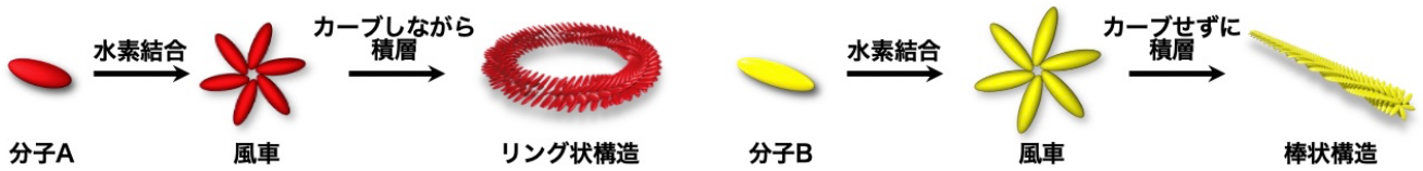
参考図2. 以前に開発したリング状構造の超分子ポリマーと、今回開発した棒状超分子ポリマーの模式図

分子 A と B を溶液中で混ぜて、分子がバラバラに存在する高温の状態からゆっくりと冷やしたところ、高温域で棒状のポリマーが先に作られ、温度が低くなるにつれて徐々にそれが曲がっていく様子が原子間力顕微鏡 注4 を用いて観察されました（参考図3 上段左と中央）。さらに室温まで冷却することで、曲がりながら伸びた渦状構造の超分子コポリマーが得られました（参考図3 上段右）。様々な分析結果から、初めにできた棒状のポリマー（参考図3 上段左）は、分子 B の風車で構成され、そこに徐々に分子 A が入り込むことで曲がる性質が生まれていくことがわかりました。