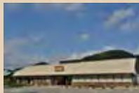
おおつの里「花倶楽部」