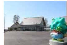
発酵の里こうざき