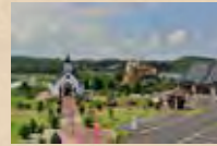
ローズマリー公園