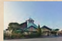
とみうら「枇杷倶楽部」