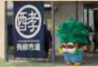
発酵の里こうざき