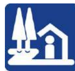
道の駅の シンボルマーク