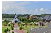
ローズマリー公園