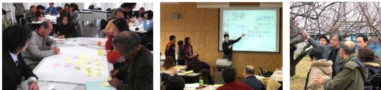
柏の葉カレッジリンク・プログラム パイロットコースの開催風景

今回の本格展開に先駆けて、2009年1月には3ヵ月間のパイロットコースを開講し、柏の葉地区周辺の市民を中心に、30代～70代まで幅広い年齢層にわたる26名が受講しました。民間企業や自治体に勤めている方、地元小学校の校長先生、定年退職された方、主婦など、様々な立場から参加した受講生は、「世代間・異業種間の交流による喜び」「街づくりに関わる生きがい」を実感していました。